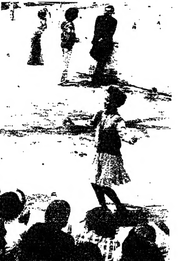
مخلة كبيرة ترقص وهم يمشون